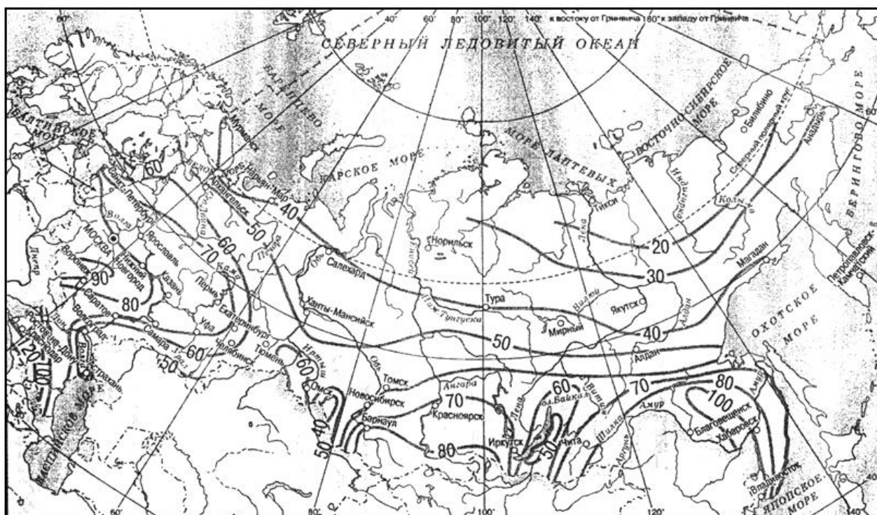
Рисунок Б.1 - Значение величин интенсивности дождя q(20)